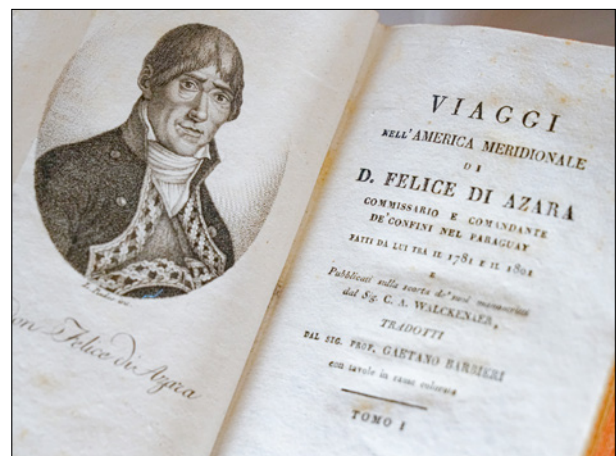
Exposición Félix de Azara

se han fotografiado, escaneado y catalogado más de 1.200 imágenes nuevas, que se irán incorporando próximamente al BIME, procedentes en su mayoría de los volúmenes que atesora nuestra Biblioteca, las cuales se han realizado con los nuevos equipos de alta resolución que la Real Academia ha adquirido, entre otros, para este fin. Para tener una dimensión de la utilidad de este banco de imágenes permítanme que diga que a lo largo del año han sido consultadas por casi 850.000 usuarios un total de 3.426.233 páginas de la Web, habiendo sido realizadas 2.139.112 descargas.