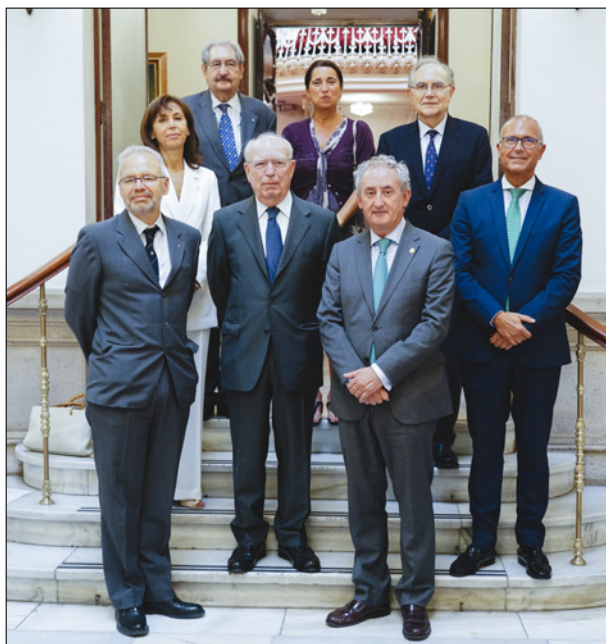
Declaración de Atocha