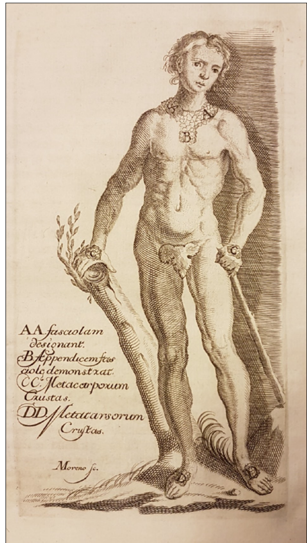
Figura 2. Grabado de la obra de Casal indicando las afecciones cutáneas del “Mal de la rosa” o “Pelagra”