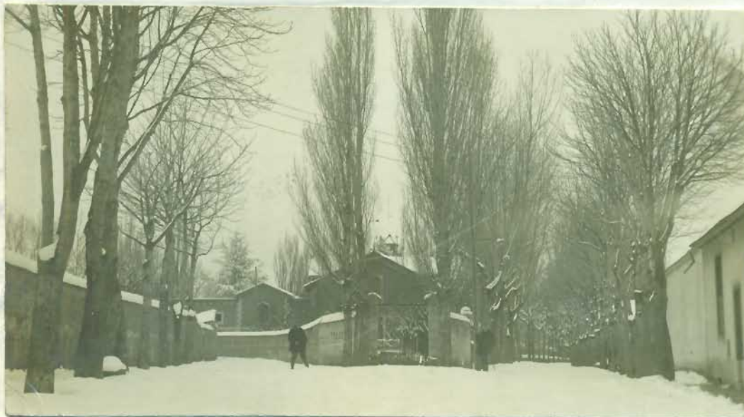
ENTRADA DE LA AVENIDA POR LA PLAZA DE BARCELONA