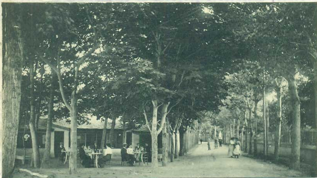
CENTRO DE LA AVENIDA DEL DR. FIGUILLEM